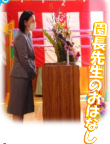
園長先生のおはなし