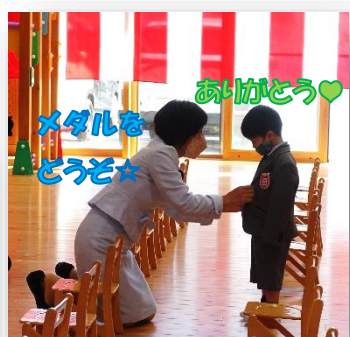
メダルを どうぞ♡ ありがとう♡