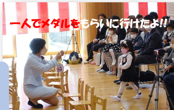
一人でメダルをもらいに行けたよ!!