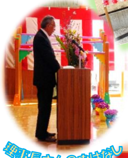
理事長さんのおはなし