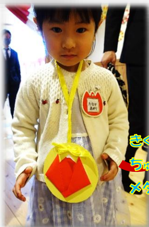
きく組さん(年長児)が ちゅういっぴ組さんの為に メダルを作ってくれました!