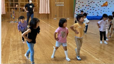
すみれ組が運動プログラムの一環で 昨年から続けている「足の速くなる体操」 上達してきました！