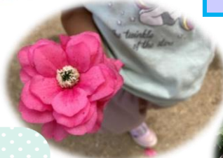
満開のツツジと シロツメクサを使って こんなにも素敵な 作品を作っています♡