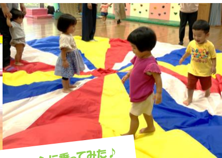
パラソルに乗ってみた♪