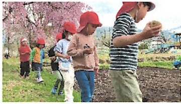
じゃがいも、にんじん植えました