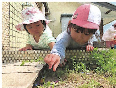
虫さ〜ん! 出ておいで〜