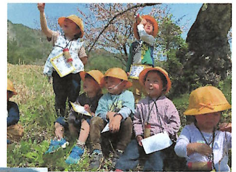
どんなにおいかな?