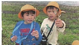
散歩で採ったつくしを食べたよ