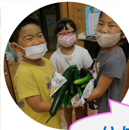
いっぱいおれたよ!