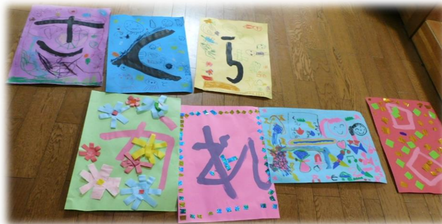
皆で作った花飾りは パーティションに付けて みました!