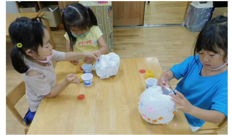
あんどんを和紙で作って飾りにします。