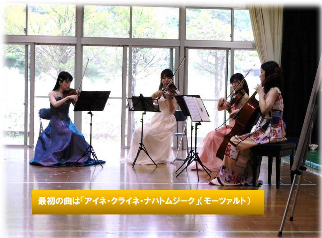
最初の曲は「アイネ・クライネ・ナハトムジーク」(モーツァルト)