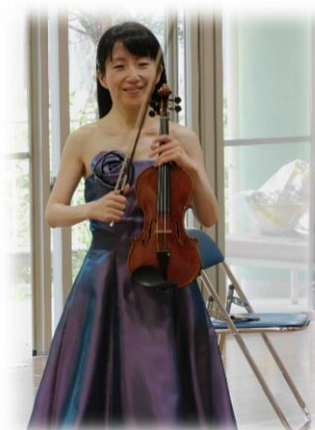
ヴァイオリン奏者の むらこしさん

高山の伝統工芸である飛騨春慶。西洋の伝統的な弦楽器と飛騨春慶が出会って生まれたのが、今日の演奏会で使われた「飛騨春慶弦楽器」です。プログラムでは、子ども達の知っている、トロやアナ雪また、アンコールには、ゆうき100%を演奏してくれました。その時は一緒に楽器に合わせて歌いました。子ども達は弦楽器から聞こえる素敵な音色を聞いて感動していました！いい経験ができました。