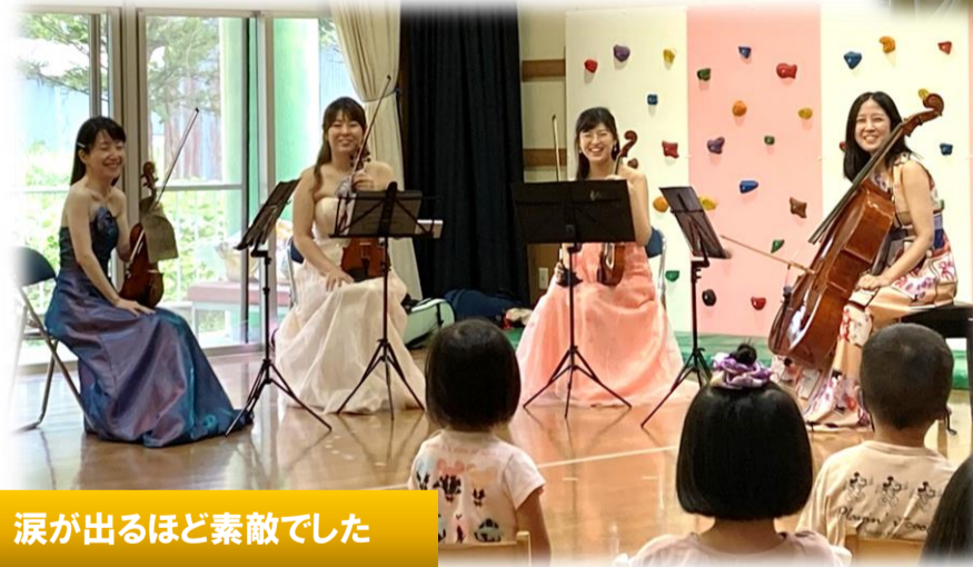
涙が出るほど素敵でした

高山の伝統工芸である飛騨春慶。西洋の伝統的な弦楽器と飛騨春慶が出会って生まれたのが、今日の演奏会で使われた「飛騨春慶弦楽器」です。プログラムでは、子ども達の知っている、トロやアナ雪また、アンコールには、ゆうき100%を演奏してくれました。その時は一緒に楽器に合わせて歌いました。子ども達は弦楽器から聞こえる素敵な音色を聞いて感動していました！いい経験ができました。