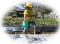
4/20 年長 じゃが芋植え 人参の種まき