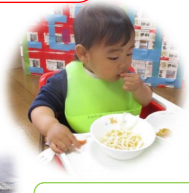
4/21 年中 ポップコーンの種まき