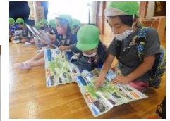
乗鞍のパンフレット 見てみよう！