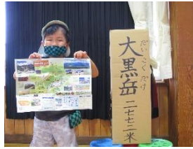
乗鞍遠足ごっこをしたよ