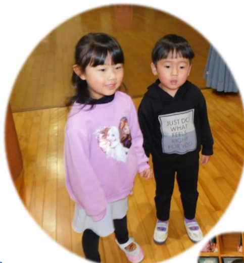
ちゅうりっぷ組です お願いします!