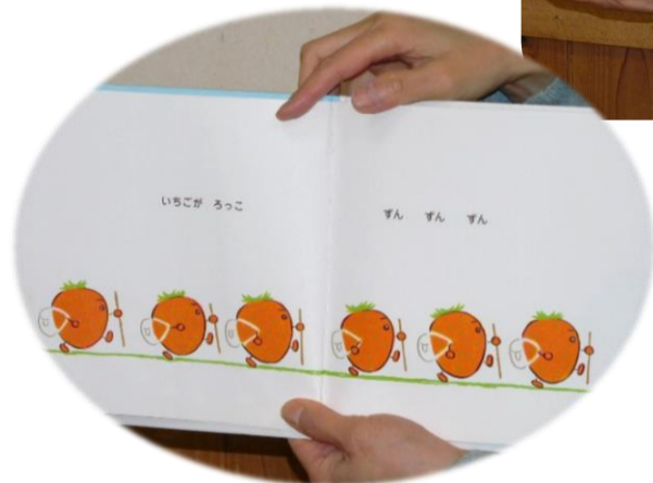
このシリーズの絵本は、 子ども達が大好きです。