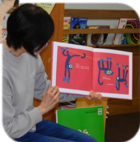
ちょっぴり緊張したあ