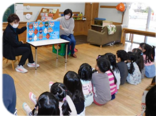
静かに聞いていました